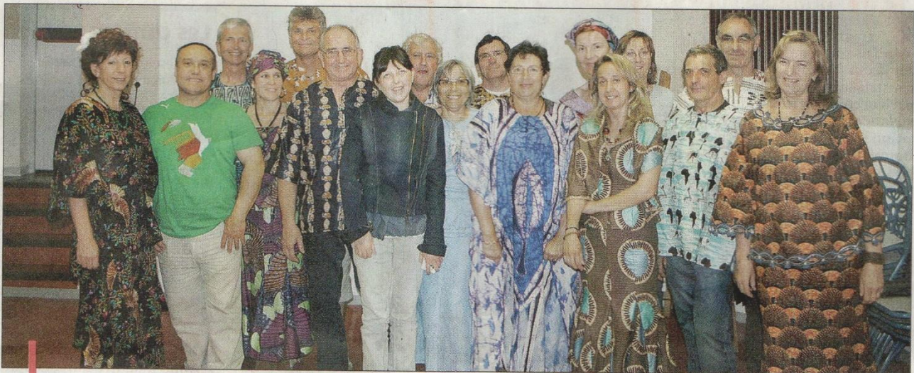
Les membres de l'association Garlaban Togo se sont retrouvés autour d'un diaporama retraçant leur séjour africain.