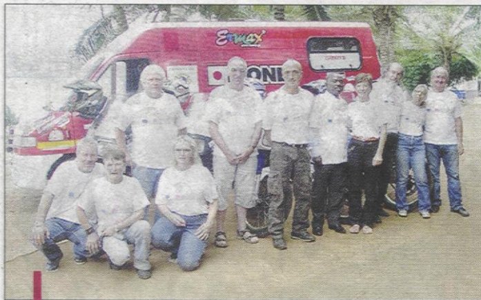
En juillet dernier, l'association a parcouru 7000 km pour acheminer un fourgon ambulance au Togo.

Une fois de plus, pour tendre la main aux enfants du Togo, l'association Garlaban Togo empoigne son étendard de la générosité et propose une grande soirée théâtrale samedi.