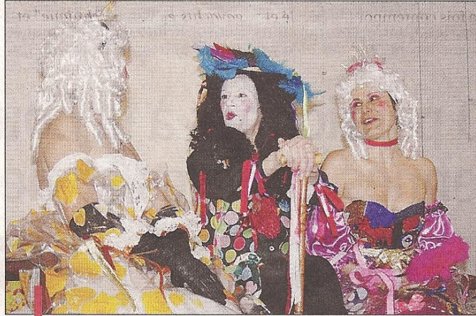
La troupe Lasc'art a offert une récréation autour des Précieuses Ridicules de Molière. Fascinant.